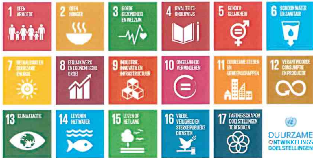
Afbeelding: sustainable development goals